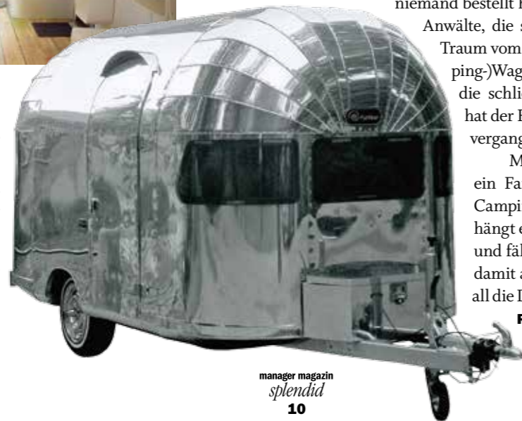
Silberpfeile: René Leenders zwischen original Airstream-Wohnwagen vor seiner Werkshalle (o.) bei Eindhoven. Nach dem Vorbild der US-Caravans baut der Ingenieur in Handarbeit eigene Freizeitmobilie im Retrolook (r.) – auf Wunsch auch mit maßgefertigtem Interieur (Mitte)