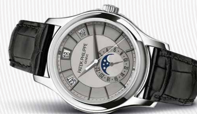
Jahreskalender Ref. 5205G

Man erfreut sich ein Leben lang an ihr, aber eigentlich bewahrt man sie schon für die nächste Generation.