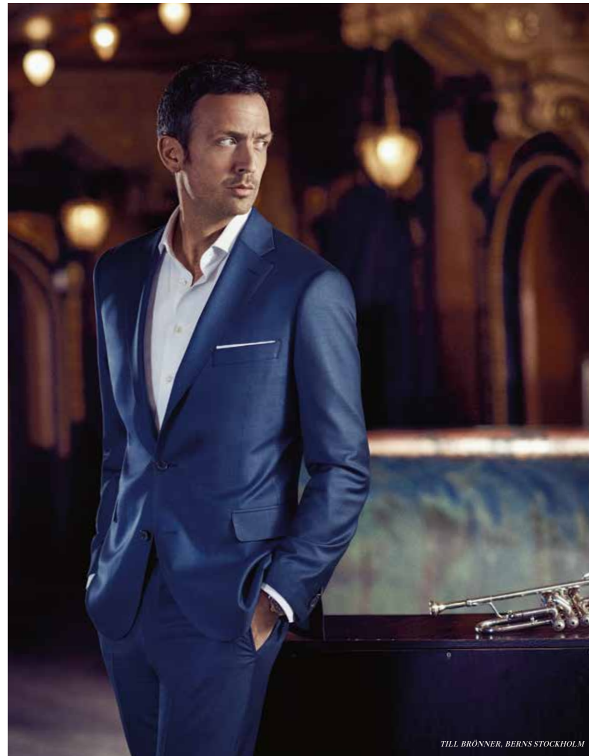
TILL BRÖNNER, BERNS STOCKHOLM