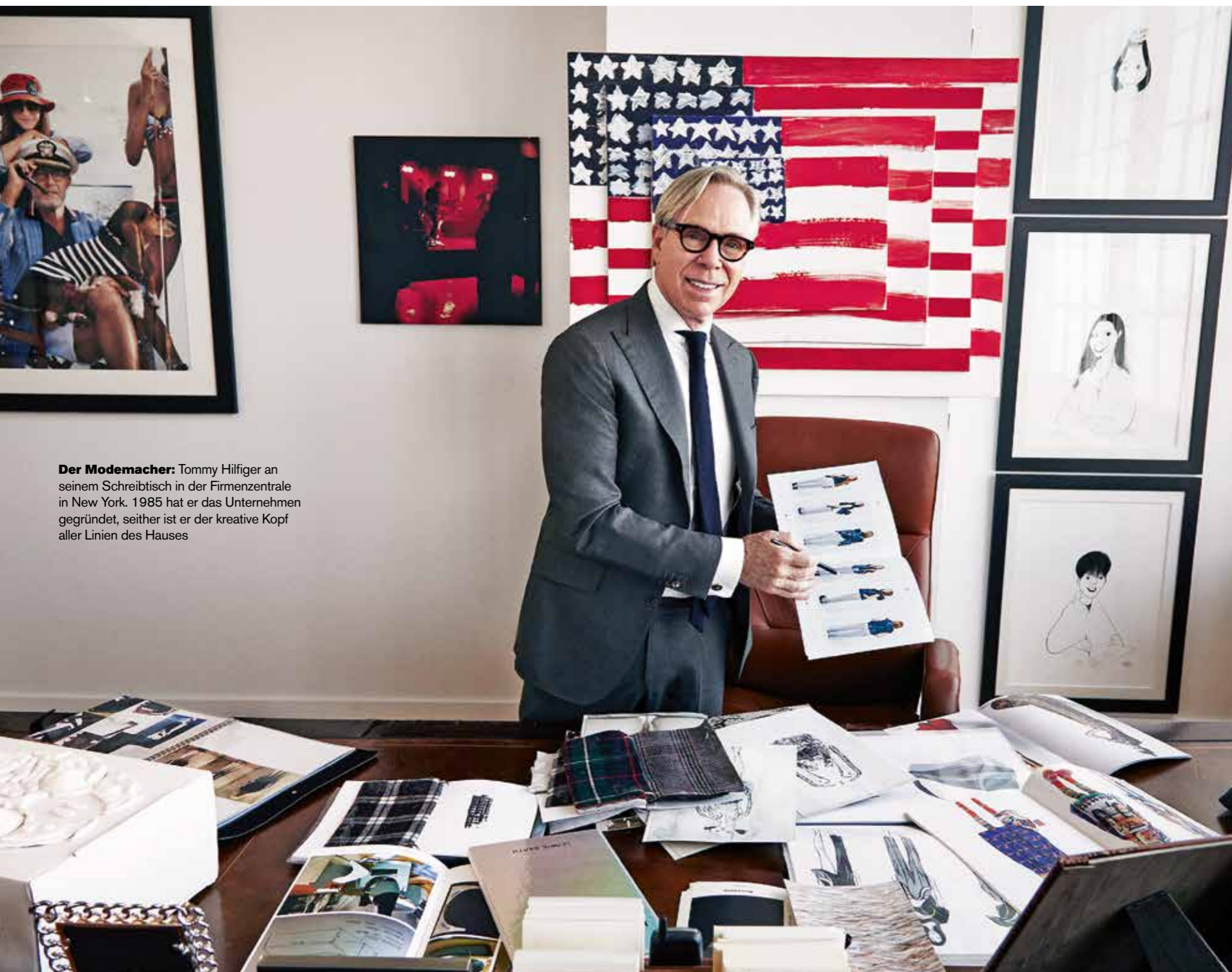
Der Modemacher: Tommy Hilfiger an seinem Schreibtisch in der Firmenzentrale in New York. 1985 hat er das Unternehmen gegründet, seither ist er der kreative Kopf aller Linien des Hauses

Tommy Hilfiger. Der Aufstieg des Designers aus der Arbeiterklasse ist so amerikanisch wie seine Marke. Gerade wurde sie 30 Jahre alt. Sein Label hat Hilfiger längst verkauft, aufhören kann er trotzdem nicht.