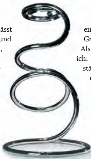
Gefährlich anders: Die Lampe „Pizza Kobra“ für iGuzzini Illuminazione

Ist Ron Arad ein Rebell, weil er nicht daran denkt, sich in einen dieser Pferche führen zu lassen? „Ach, nein“, winkt er ab. „Um ein Rebell zu sein, muss man erst einmal die Grenzen anerkennen – sonst kann man sie nicht zerschlagen. Ich saß