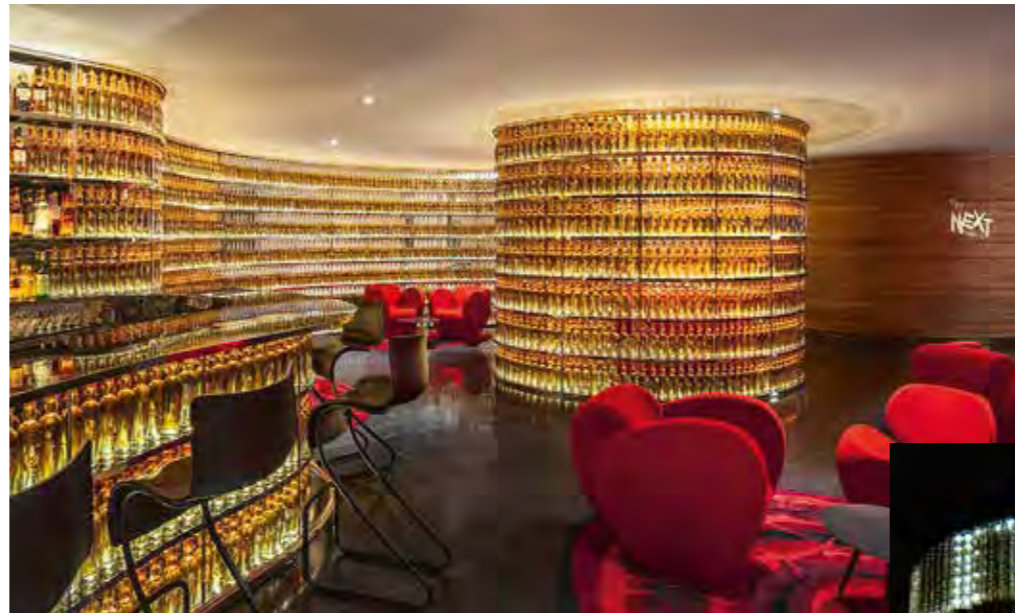
Runde Sachen: Arads „Next Whiskey Bar“ aus 2500 beleuchteten Whiskeyflaschen im Watergate Hotel in Washington (l.); Kronleuchter „Lolita“ aus LEDs und Kristallen für Swarovski, auf dem SMS-Nachrichten aufleuchten (u.)

Also skizziert er alles zuerst auf dem Tablet und schickt den Entwurf dann an seine Mitarbeiter, die ihn in eine technische Zeichnung übertra-