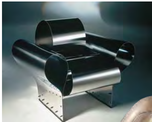
Perfekter Sitz: „Looming Lloyd“-Schaukelstuhl von 1992 (ganz oben); „Well Tempered Chair“ für Vitra (o.); „Rover Chair“ von 1981 (r.); Sofa „Glider“ für Moroso (Seite rechts)

Arad erledigt aber auch klassische, eher zahme Auftragsarbeiten: ein Besteck für WMF, einen Parfümflakon für Kenzo, einen Champagnerkübel für Ruinart. Der typische Arad-Twist zeigt sich eher in Produkten wie der Lampe „PizzaKobra“, die er für iGuzzini Illuminazione designte: Sie besteht aus einem chromglänzenden Schlauch, der im Ruhezustand flach und kringelig