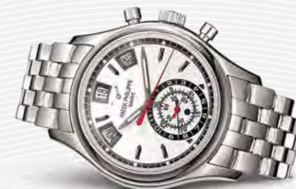
Jahreskalender Chronograph Ref. 5960/1A

Man erfreut sich ein Leben lang an ihr, aber eigentlich bewahrt man sie schon für die nächste Generation.